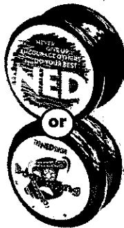
BOOMERANG® Auto-return feature