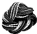
Replacement String Pack